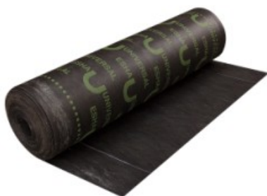
Foto: rol Esha Universal

Esha Universal maakt haar naam waar: een universeel toepasbare kunststof dakbedekking. Deze unieke eenlaagse dakbedekking met een laagdikte van ca. 3,1 mm is flexibel, zeer sterk, stabiel en uniek duurzaam. Het materiaal heeft zijn sterke en hechte structuur te danken aan de bijzondere samenstelling: een met polyester en glasvezel versterkte POCB-compound (Poly-Olefine-Copolymerisat-Binder) Esha Universal is er ook in een worteldoorgroeibestandige kwaliteit, de Esha Universal WS en een zelfklevende versie de Esha Universal ZK