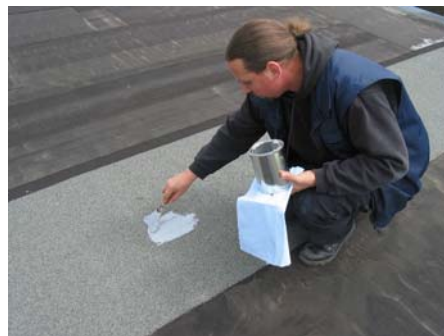
Aanbrengen coating (testvlak)

Esha NOx Coating is een watergedragen non-ionische emulsie van bitumen en water met additieven zoals emulgatoren en katalysatoren. Deze pasta heeft een luchtzuiverende werking door het neutraliseren van schadelijke NOx en gasvormige koolwaterstoffen (VOC)